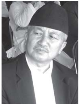
कोरम नै नपुगी सञ्चालन गर्ने र

राजनीतिक विश्लेषकहरूका अनुसार उनी आफैँ प्रधानमन्त्री बना चाहन्छन् । यसका लागि प्रधानमन्त्रीका उम्मेदवार रामचन्द्र पौडेललाई दिन दिने हराएर थोत्रो पार्न र राजनीतिक सहमति बन्न नदिएर के गर्ने के गर्ने भन्ने स्थिति सिर्जना गर्नु जरुरी छ । यही उद्देश्य पूर्ति गर्न २०१ को संसदमा गणपुरक संख्या कोरम नपुगे पनि उनी संसद् चलाइरहेका छन् र रामचन्द्रलाई हराइ रहेका छन् । उपहासपूर्ण रूपमा संसद् चलाउने कानूनची सुवास नेम्वाङ दलहरूलाई निर्देशन दिएर आफ्नो कतिव्य निर्वाह गरिरहेका छैनन् । उनी भन्दा राष्ट्रघाती, शान्ति र सविधान विरोधी अरु को हुन सक्छ ।