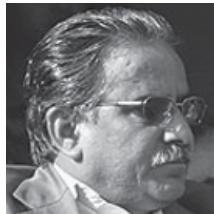
सहकार्य खोजिरहेका यी शीर्ष ३ दल अब एक दोसालाई प्रधानमन्त्री मान्न

काठमाडौं / राप्रपा नेपालका अध्यक्ष कमल थापाले २९ गते पार्टी कार्यकर्ताहरू र आम जनतालाई सडकमा उतारेर जनतालाई ज्ञापनपत्र बुझाएर देशव्यापी जनआन्दोलनको आगो फुट्टेने प्रयास गर्ने भएका छन्। संविधानसभाले संविधान लेख्न र संसदले सरकार निर्माण गर्न नसकिरहेको सन्दर्भमा फलाम तातेकै बेलामा हम्मर हान्नुपर्छ भन्ने सिद्धान्तलाई अंगीकार गरेर यो सघर्षको कार्यक्रम अगाडि सारेको अनुमान गरिएको छ। अखैरै संविधानसभालाई खोजेर तान्ना जनविशेषा जाने माग सो दिन राप्रपा नेपालले उठाउने निश्चित ठानिएको छ। राप्रपा नेपालले नेपाली जनतालाई ज्ञापनपत्र बुझाएर आन्दोलनको शंखघोष गर्ने भएको छ। भोली २७ गतेदेखि देशव्यापी (बाँकी अन्तिम पेजमा)