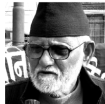
मनास्थितिमा पुगेका छन्। अध्यक्ष मण्डलको अध्यक्ष को ? यसमा पनि