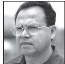
सहर्मातिको वाधक भन्दै मरीजा भन्ने (बाँकी अन्तिम पेजमा)