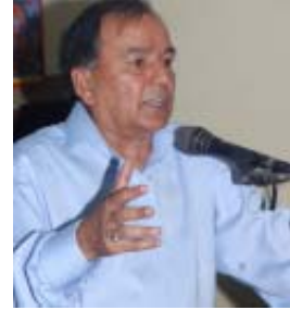
प्रधानमन्त्रीको दौडका लागि एकीकृत नेकपा माओवादीका अध्यक्ष पुष्पकमल