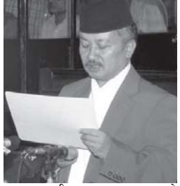
प्रधानमन्त्री छान्न नसकेन संविधानसभाले भदौ २० गते छैटौं

काठमाडौं / साउन ५, ७, १७ र २१ जस्तै भदौ ७ गतेको व्यवस्थापिका संसदले पनि प्रधानमन्त्री छान्न सकेन। एउटा