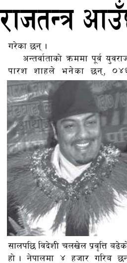
सालपछि विदेशी चलखेल प्रवृत्ति बढेको हो। नेपालमा ४ हजार गरिब छन्

तरे, एनजिओको संख्या १ लाख ६५ हजार भन्दा बढी छ। यी सबै विदेशीबाट चलेका छन्। सबैलाई थाहा छ एनजीओले जनताका लागि के गरिहेका छन्। विदेशीहरू सजिलोबाटो एनजीओ आइएनजीओको माध्यमबाट छिरेका छन्। विदेशी आउनसाथ के के न गर्न आए भन्छौं, उनीहरू आफ्नो स्वार्थ लिएर आएका हुन्छन् भन्ने हामीले विर्सका छौं। पूर्व युवराजले स्पष्ट शब्दमा भनेका छन्, कसैलाई दोष दिन चाहन्न तर परिवर्तन खोज्ने हो भने जेनेरेसन चेन्ज नभइ हुन्न। जनता निर्णायक हुन जनताले चाहे भने जे पनि हुनसक्छ। बुवाले गद्दी त्याग गरेको जनताको लागि हो। राजसंस्थाले (बाँकी पाँच पेजमा)