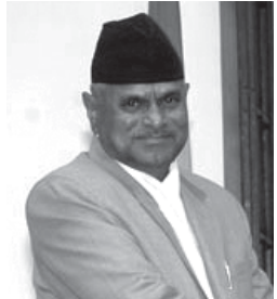
प्रधानमन्त्री दिन नसकेको व्यवस्थापिका संसद र ठूला पार्टीहरूसँग राष्ट्रपतिले चिन्ता व्यक्त गर्दै 'छिटो गर' भनेका छन्। पाचौं पटकको चुनावबाट पनि