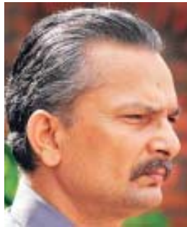
संघर्षका कार्यक्रम ल्याउने निर्णय गरेको बताइन्छ ।