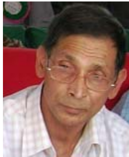
माओवादीले करिब २० वर्षदेखि हुन नसकेको राष्ट्रिय महाधिवेशनको सडा

केन्द्रीय विस्तारित बैठक गर्ने निर्णय गरेको छ । विस्तारित बैठक असोज पहिलो साता राजधानीमा हुनेछ । 'हाल महाधिवेशन स्थगन गरी विस्तारित बैठक गर्ने निर्णय भएको छ ।' पोलिटव्युरो बैठकमा नयाँ कार्यदिशा तय गर्ने महाधिवेशन गर्नुपर्ने माग नेताहरूले गरेका थिए । गत मांसिकको केन्द्रीय समिति बैठकले महाधिवेशन एक वर्ष स्थगनको निर्णय गरेको थियो । गत साउनको केन्द्रीय समिति बैठकले गत माघमा महाधिवेशन गर्ने निर्णय गरेको थियो । विस्तारित बैठकमा शान्ति र संविधानको बाटोबाट अघि बढ्ने कि जनविद्रोहको तयारी गर्ने भन्ने विशेष (बाँकी सात पेजमा)