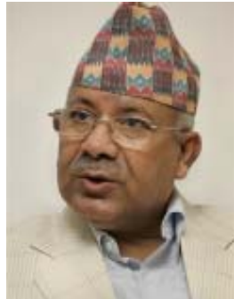
'पद लाभ' ग्रहण गरिरहेका छन् । राष्ट्र कता गइरहेको छ, राष्ट्रको नीति के हो, आगामी कार्यक्रम र कार्यविधि के हो कसैलाई मतलब छैन । मुलुक सचिब र (बाँकी सात पेजमा)

काठमाडौं । राष्ट्रिय सहमतिको सरकारका निमित्त आफू बाधक नबन्ने कुरा पटक-पटक दोहोर्‍याउँदै आए पनि प्रधानमन्त्री माधवकुमार नेपाल सहजै पद त्याग्न तयार छैनन् । असार १५ भइसक्दा पनि संसदको वर्षे अधिवेशन अन्यौलग्रस्त रहेको छ । यसले गर्दा नीति, कार्यक्रम, सरकारी धारणा तथा वार्षिक बजेट सबै अन्यौलपूर्ण रहेको छ । जेठको २५ गते नै वर्षे अधिवेशन डाक्ने भनेर सभामुख, प्रधानमन्त्री र राष्ट्रपति जति नै समुत्सुक रहे पनि अधिवेशन आह्वान गर्ने कुरा धरापमा परेको छ । दस दल अठार दल र बाइस दलले बाह्यरी कुरा गरे पनि र जति नै डोरी बाँधे पनि काम कुरो तय भइरहेको छैन । राष्ट्रपति अवाक, प्रधानमन्त्री गम्भीर र सभामुख निष्क्रिय पारामा आ-आफ्नो